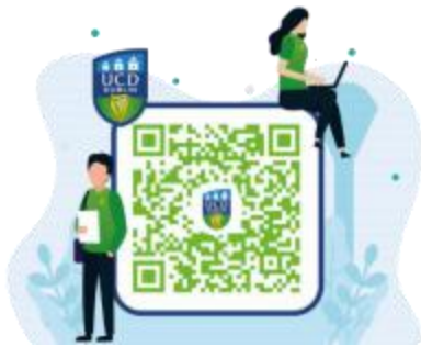
都柏林大学官方微信